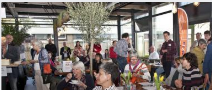
Medewerkers en relaties bij de opening

Aan het Huis waren in 2021 maar liefst 125 vrijwilligers verbonden. Verdeeld over de diverse activiteiten. Veel verschillende taken vervullend: van coördinatie tot algemene ondersteuning en alles daar tussenin. Het aantal vrijwilligers nam in 2021 toe, vooral dankzij het maatjesproject, Nijmegen in Dialoog en Energiecoaches en Energie ambassadeurs. We zijn ontzettend trots op onze trouwe en kundige vrijwilligers. Ook waren er in 2021 8 stagiaires, allemaal van de opleiding Social Work. De vrijwilligers werden ondersteund door een part time coördinator (24 uur) en een andere vaste medewerker (8 uur) en 5 tijdelijke medewerkers met merendeels een klein aantal uren.